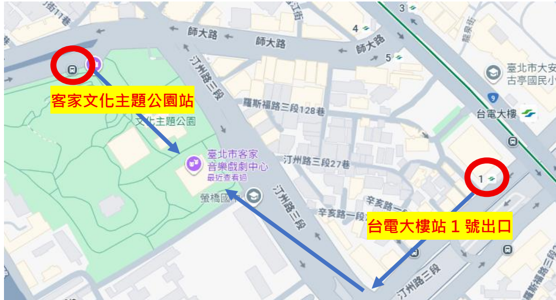
圖 2：捷運出口、客家文化主題公園以及前往中心路線