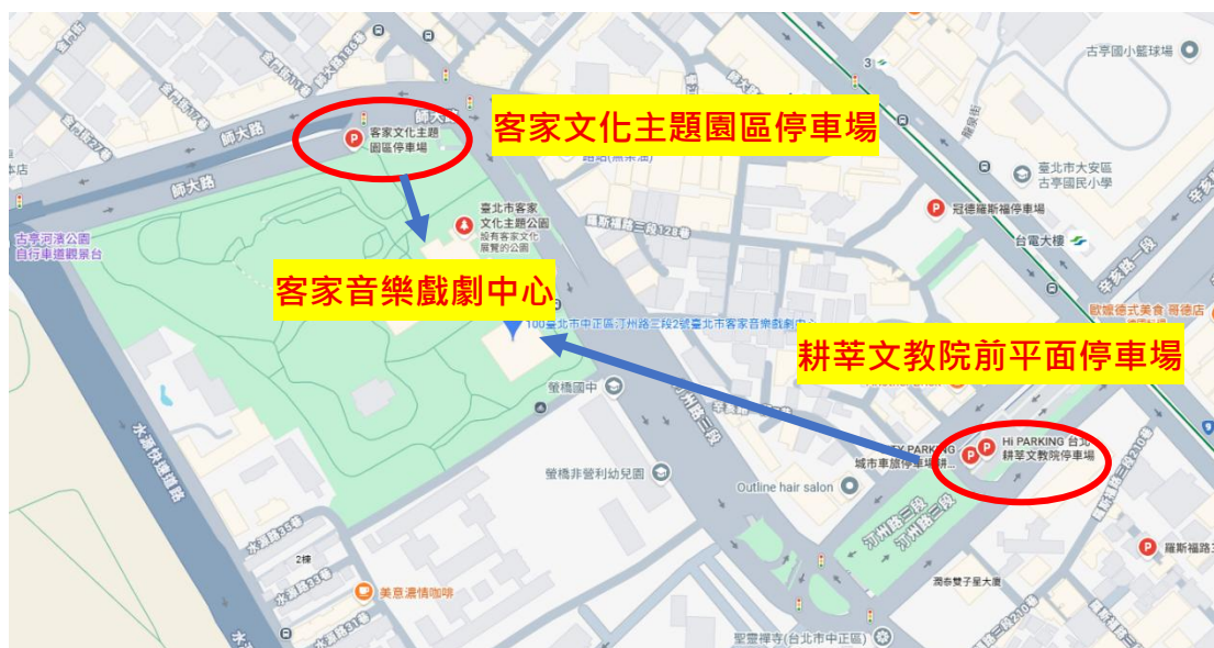
圖 4：周邊停車場位置