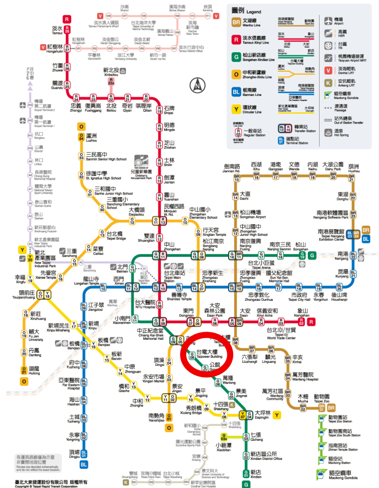
圖 1：捷運路線圖台電大樓站位置